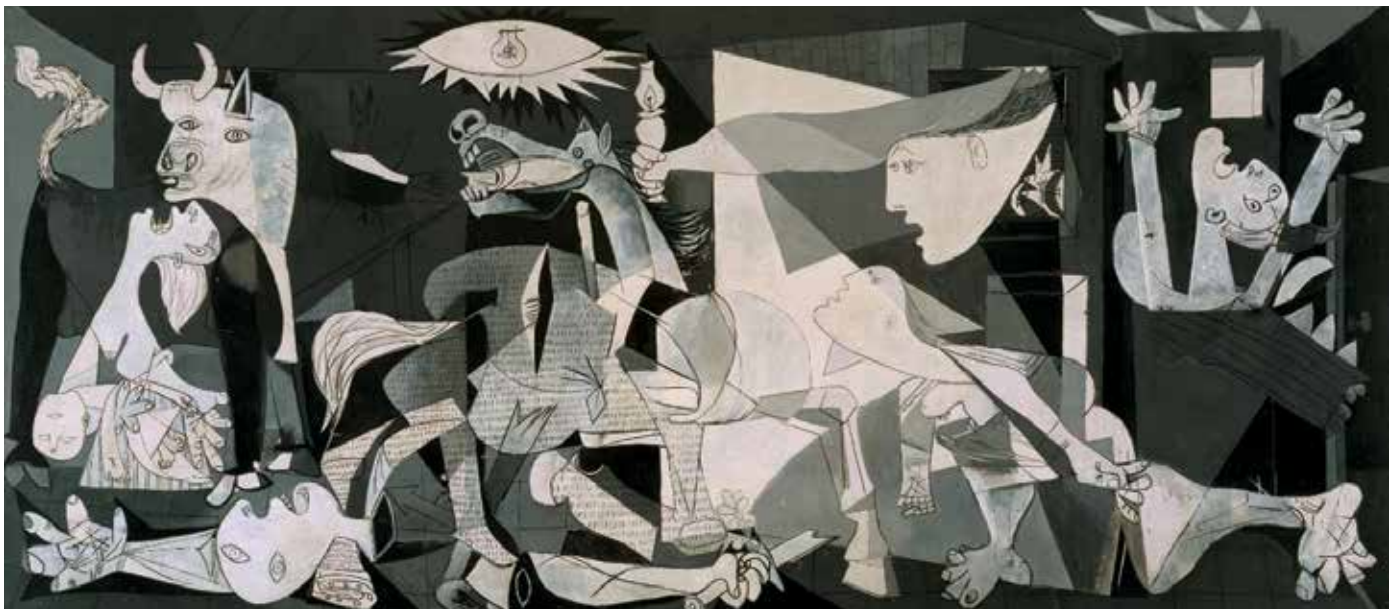
Pablo Picassos „Guernica“: das Ölgemälde ist unter dem Eindruck des verheerenden Luftangriffs der „Legion Condor“ auf die baskische Stadt Gernica vom 26.04.1937 entstanden (das Originalgemälde kann bei Interesse von uns im „Museo Reina Sofía“ in Madrid besichtigt werden).

vom 29. September bis 7. Oktober 2018 (9 Tage)